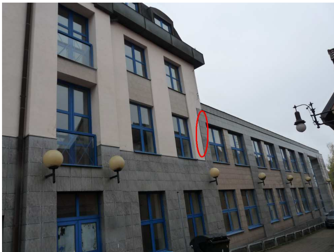
Detail zakončení obložení na západní stěně